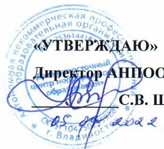
График оценочных процедур на 2022/23 учебный год